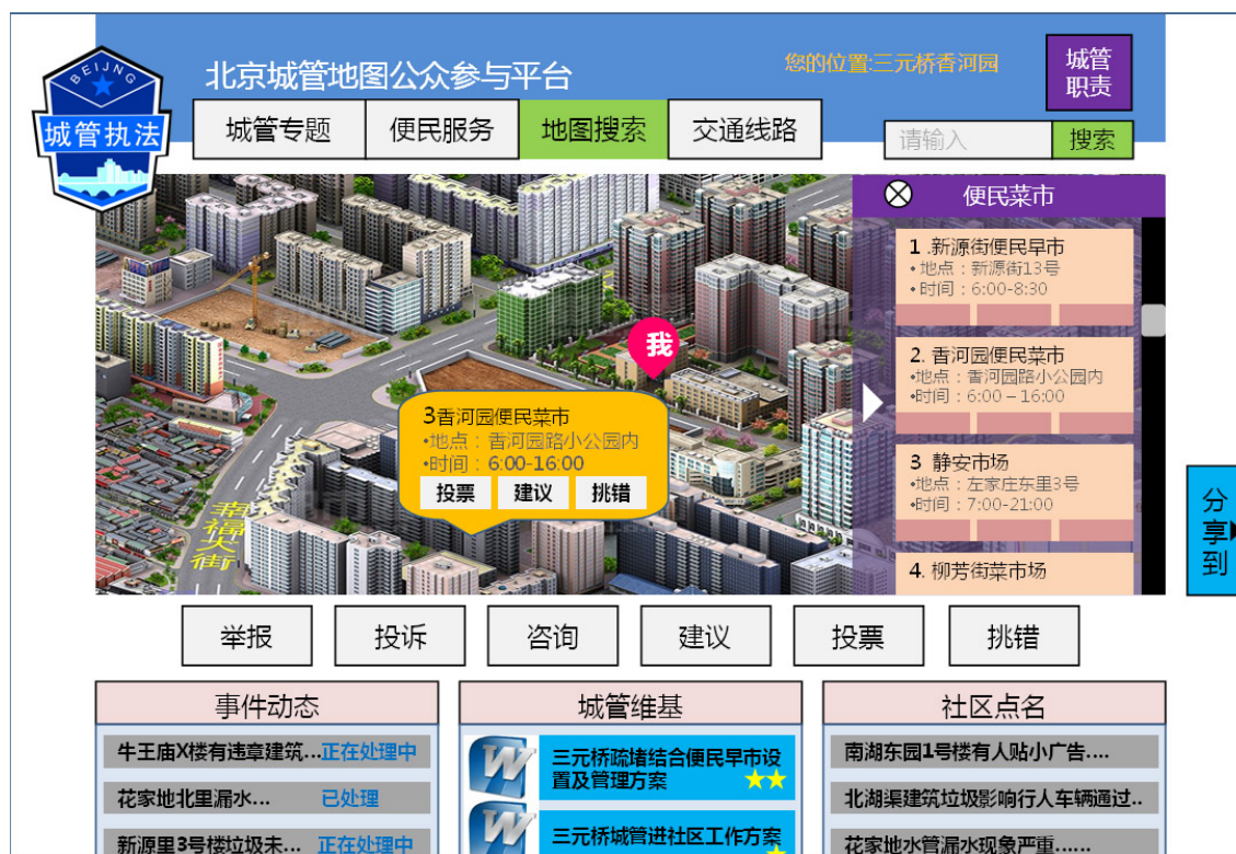
图 3 面向创新 2.0 的城管地图公共服务平台

北京市城市管理部门通过借鉴市场领域苹果 App Store、欧洲 Living Lab 等创新 2.0 模式，依托北京市地理信息服务基础设施以“城管地图”公共服务平台为载体开展了公共服务模式创新的探索。